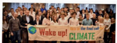
Gebäudetechnik-Schüler der HTL Pinkafeld nahmen an der 1. Burgenländischen Jugendklimakonferenz teil.